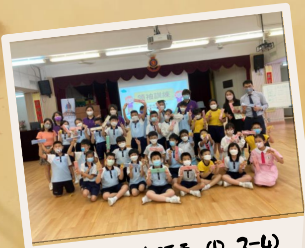
領袖訓練活動 (P. 3-4) ~按此觀看~