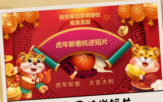
虎年新春抗逆短片 ~按此觀看~