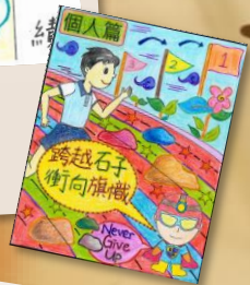
堅毅主題漫畫 (P. 6) ~按此觀看~