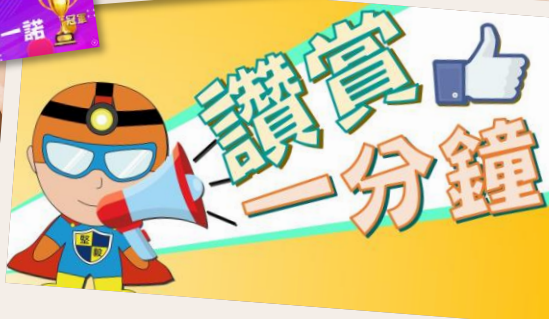
讚賞一分鐘 ~按此觀看~