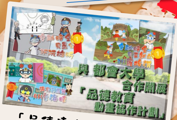
與都會大學合作開展 「品德教育 動畫協作計劃」 「品德達人故事新編」 寫作比賽 ~按此觀看~