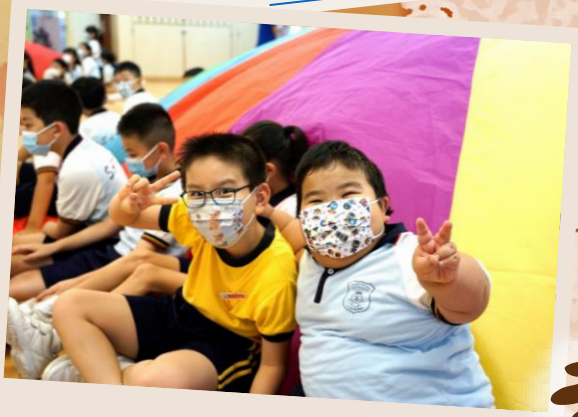
堅毅體驗活動 ~按此觀看~