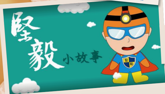
老師分享 ~按此觀看~