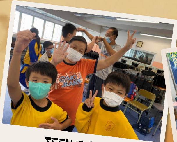
TEEN使行動 老幼 · 老友「動」起來 ~按此觀看~