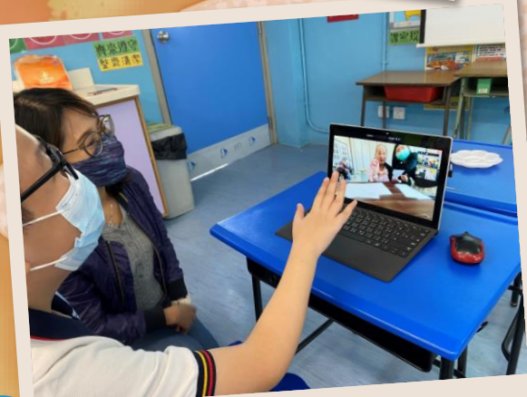
TEEN使行動 美妙書園活動 ~按此觀看~