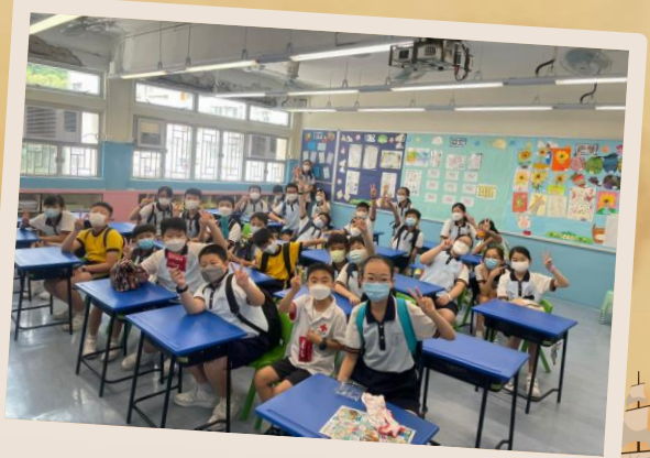
抗逆避災活動 (P. 5-6) ~按此觀看~