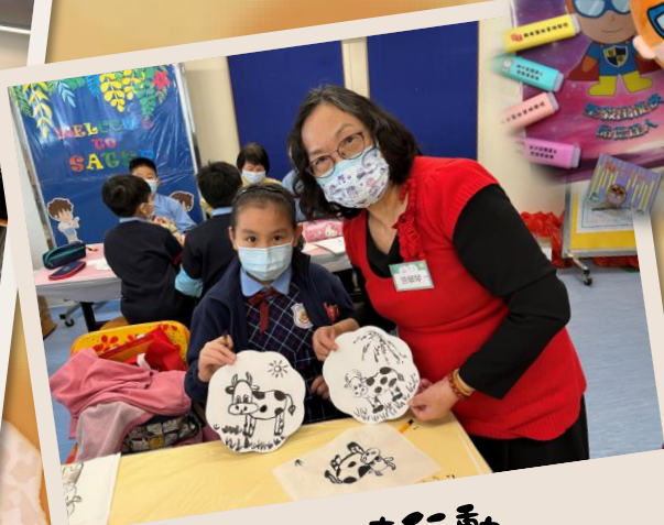
TEEN使行動 老幼 · 老友「塗」起來 ~按此觀看~