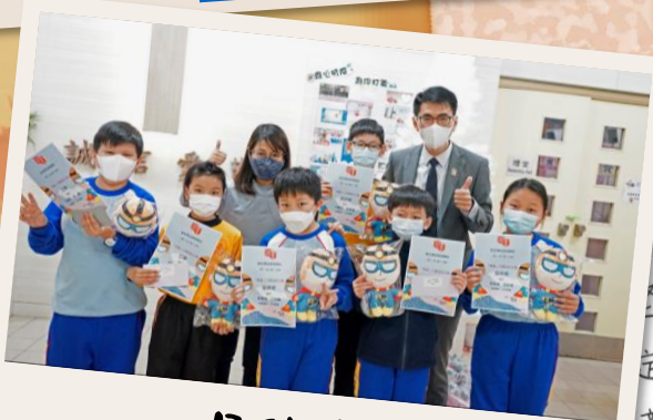
品德達人 填色及口號設計比賽 ~按此觀看得獎作品~