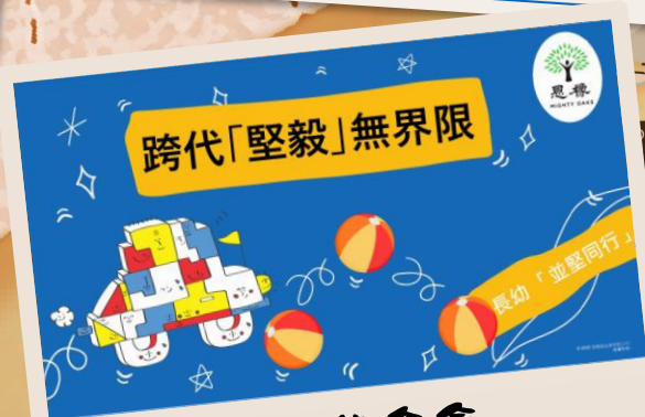
恩檢基金會 跨代堅毅無界限網上講座 ~按此觀看~