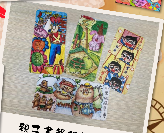
親子書簽設計比賽 ~按此觀看得獎作品~